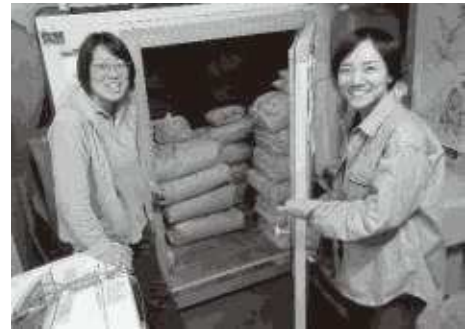
群馬県館林市の農家で田んぼを借りて 米づくり 。写真は秋に収穫したコメと。

路上生活をしている人たちが必要としていることをやろうと、2000年から食を支える「 フードバンク 」、2001年から医療を支える「 隅田川医療相談会 」を続けてきました。2013年には、人手不足の解消と居場所づくりを目指して、合同でフードバンクの仕分けをする「 共同作業日 」を始め、それをきっかけとして2019年にフードバンクと相談会が統合、「一般社団法人あじいる」が誕生しました。法人格をとってから、「 資源回収 」を始めました。また、年配の仲間の人生語りを冊子にして社会へ発信する「あしあとプロジェクト」にも取り組んでいます。