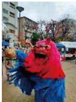
←ひと・もの・くらし あらかわ再発見 昨年度開催時の様子