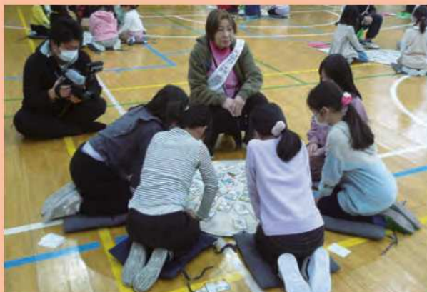
対戦相手を変えながら4試合行いました

これからもカルタを通して、温かい「あらかわの心」の輪が地域に広がっていくよう、活動を続けていきます。