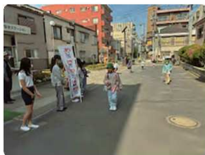
あいさつ運動の様子

との嬉しいお言葉をいただきました。これからも、子どもたちと共に、尾久西小学校に関わる全ての人々が笑顔で過ごせる学校づくりを進めて参ります。