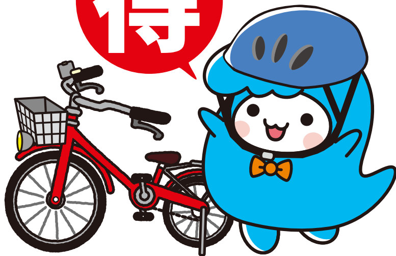
※写真はイメージ画像です