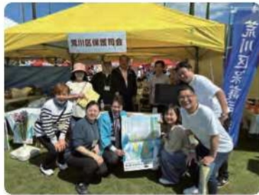
ブース出展（川の手荒川まつり）

荒川区保護司会では、今後も地域のイベントなどを通じて、保護司の活動を身近に感じていただけるよう、引き続き取り組んでまいります。