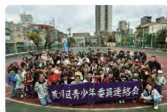
ロゲイニング大会

これからも地域を愛する温かい心を育むことができるようなイベントにしていきたいと思っております。