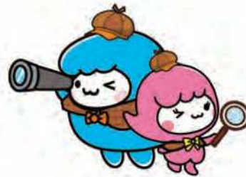
あらかわ あらみい

今号では、第17回「あらかわの心」カルタ大会の様子や参加団体の活動報告についてお届けします。