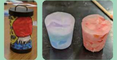
電子ちょうちん・キャンドル