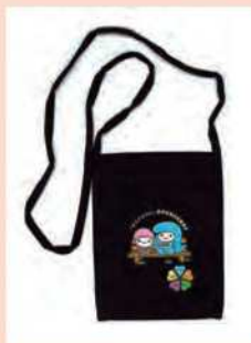
オリジナルサコッシュ (ネイビー)

なお、いただいたご意見等は、ニュース等の広報誌でご紹介させていただくことがありますので、ご了承ください。