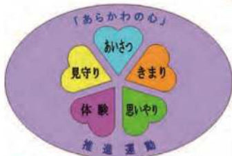
「あらかわの心」推進運動 シンボルマーク

今号では、第17回「あらかわの心」カルタ大会の様子や参加団体の活動報告についてお届けします。