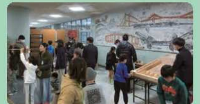
生徒製作の遊具で遊ぶ様子