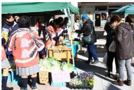
昨年の様子（三河島菜販売）