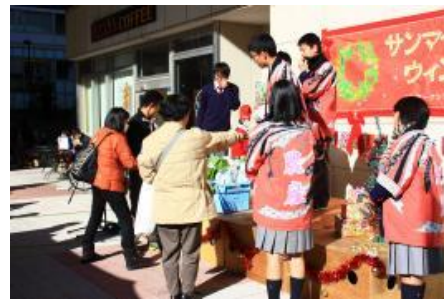
昨年の様子（三河島菜販売）