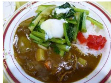
三河島菜の巣籠り玉子カレー