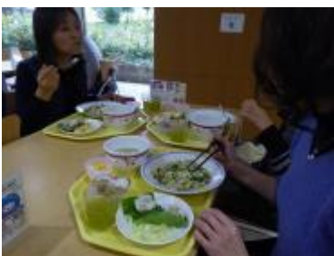
三河島菜フェア1日目

今年は、週の半ばに祝日がある関係で、計4日間の開催日程でしたが、各日盛況で、お客様は美味しそうに三河島菜の定食を味わっていました。