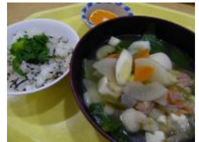
三河島菜入りすいとんと 三河島菜のひじきご飯