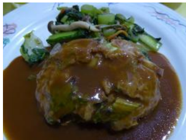
三河島菜入りグリルハンバーグ