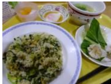
三河島菜炒飯と点心