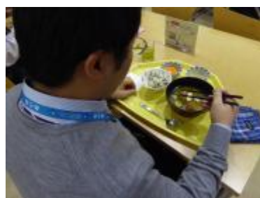
三河島菜フェア2日目