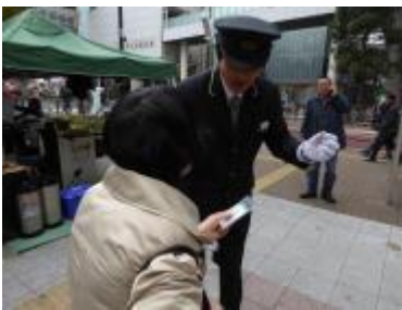
三河島菜の種の配布

駅員さんたちはマルシェにいらした方々に丁寧に説明をしながら、三河島菜の種を渡していました。