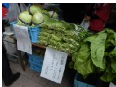
三河島菜とその他の野菜