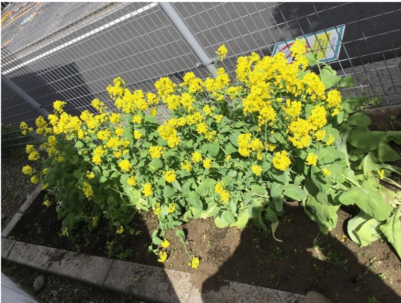
駅構内で栽培している三河島菜

JR 三河島駅では、毎年駅構内のプランターにて三河島菜を栽培しています。（公開していません） 三河島菜販売イベントを実施したときには、収穫した種を駅員さんが自ら配布するなど、三河島菜復活の取組を一緒に盛り上げていただきました。