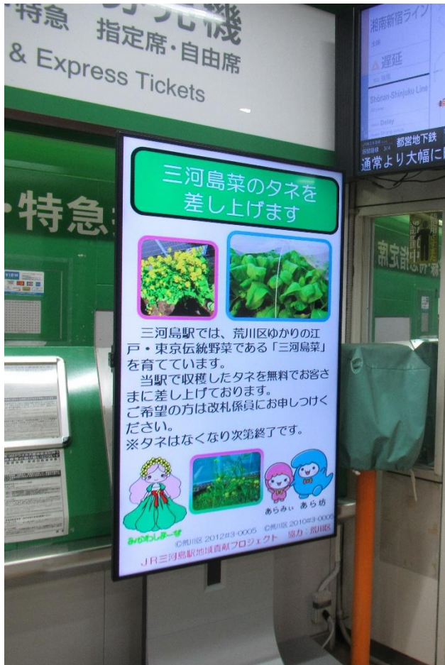
三河島駅構内のデジタルサイネージ

荒川区のマスコットキャラクター「あら坊」・「あらみ」のほか、「みかわしまーな」も登場しています。