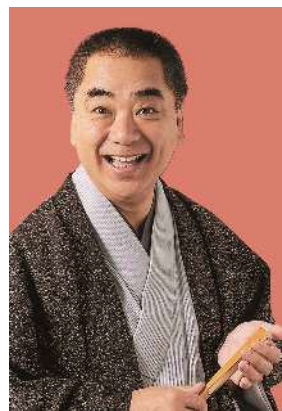
三遊亭好楽（落語家）