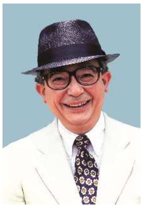
井崎 脩五郎（競馬評論家・タレント）