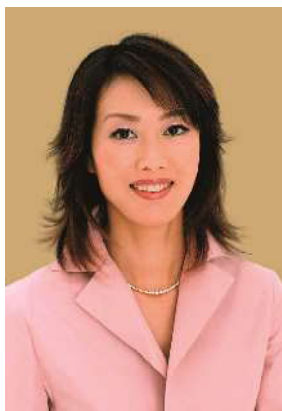
城戸真亜子（洋画家）