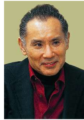
片岡 鶴太郎（俳優・画家）