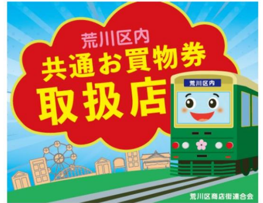
お買い物物券取扱店ステッカー