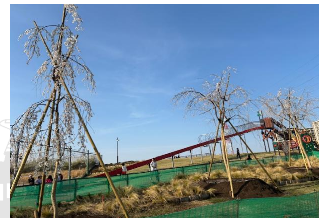
【御寄贈いただいた桜】