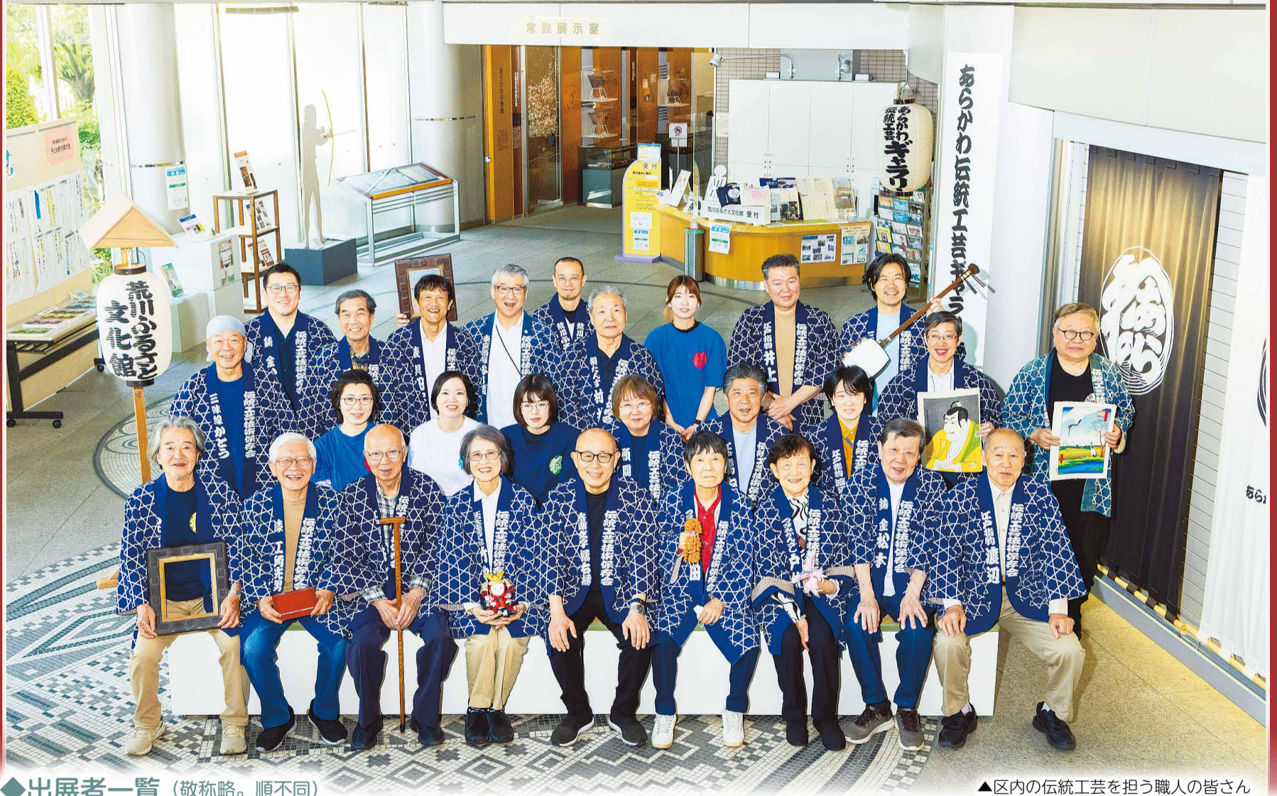
▲区内の伝統工芸を担う職人の皆さん