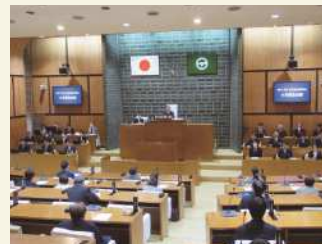
▲4月緊急会議の様子

4月3日に緊急会議が開かれました。 緊急会議では区長から議案1件が提出され、原案どおり可決しました。