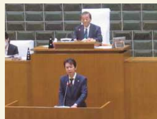
▲閉会会議における区長挨拶の様子

4月30日に閉会会議が開かれ、令和7年度荒川区議会定例会が閉会しました。 閉会会議では区長から議案2件が提出され、いずれも原案どおり可決しました。